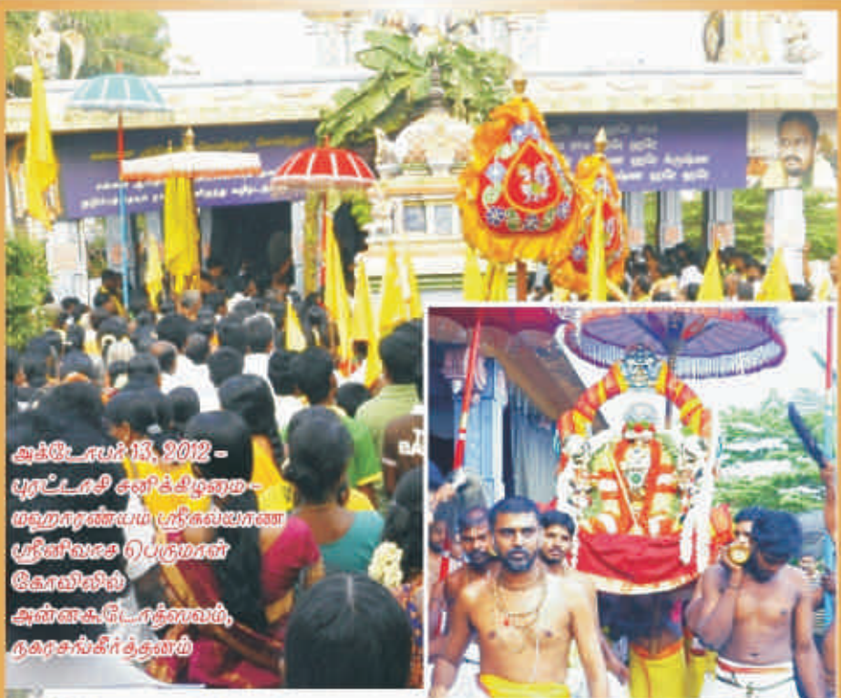
ஆக்டோபர் 13, 2012 - புரட்டாசி சனித்தீர்த்தம் - மஹாநாண்டம் ஸ்ரீஸயகாண ஸ்ரீனிவாச பெருமான் கோவிலில் அள்ளுகட்டாத்தாவம், நகராசங்கீர்த்தனம்