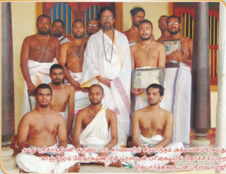
தமது ஸ்ரீசாந்தியனி குருகுல பாடசாலைமில் திரமரந்தம் அத்யயனம் செய்து காஞ்சிபுரம் வேதரகடண நிதி முரஸ்டின் பரீகையிலி இதர்ச்சி 6)பற்ற வித்யபார்த்தகளுடன் ஸ்ரீஸ்வாமியீ